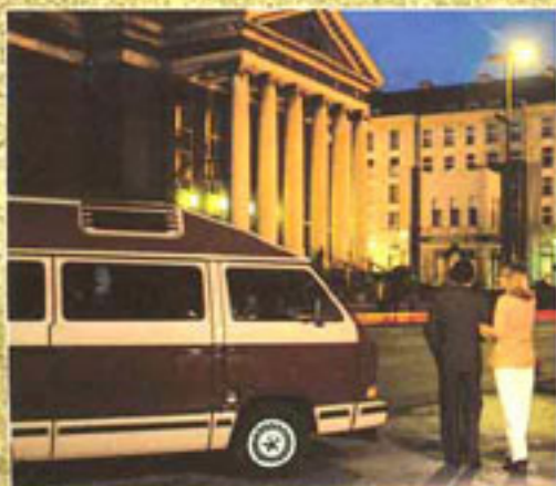
Der Profi hat ein ausgesprochen attraktives Design. Er kann sich überall sehen lassen. Und wird gesehen.