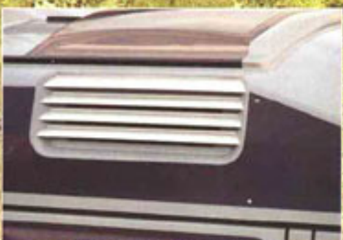
Zugfreie Belüftung durch Hochdach- fenster mit Insektenschutz. Das große Schie- bedach im Hochdach ist doppelt verglast und hat Verdunklungs- und Insektenschutz-Rolle.