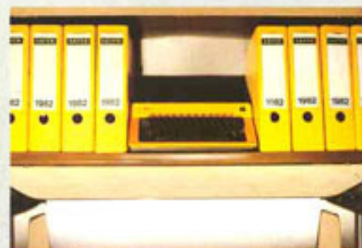
Der Dachbereich im Heck dient als Büroschrank, als Stauschrank oder zur Aufnahme der ausziehbaren Doppelliege.