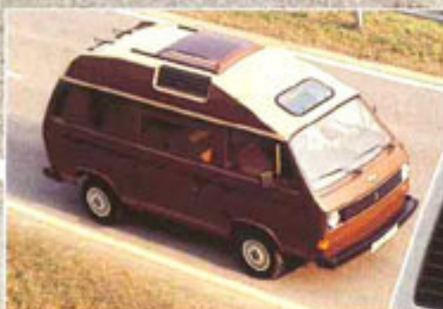
Hoch- und Flachdach-Profi gibt es in Junior- und GL-Ausstattung (Abb. Hochdach „Junior“)