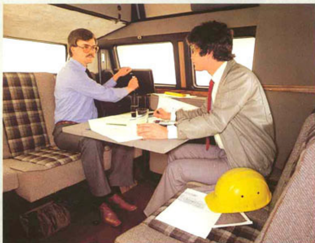
In diesem Büro läßt sich bequem arbeiten. Auch während der Fahrt. Zu zweit oder zu viert.