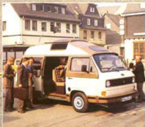
Als idealer Reisewagen bietet der Profi auf komfortablen Sitzen bequem Platz für 6 Personen.