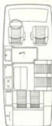
Winkelkombination mit ausgeklappter Dachvorrichtung

Kommen Sie und steigen Sie ein. Entweder direkt bei Dehler in Meschede-Freienohl oder bei Ihrem Volkswagen- und Audi-Partner in Ihrer Nähe.