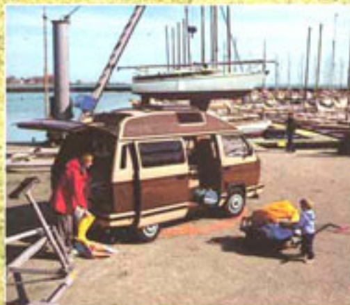
Der Profi für's Hobby: Viel Platz für Gepäck, 1800 kg Anhängelast, Surfbrett-, Ski- und Sonnendach-Halter.