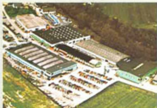
Dehler-Yachtbau: Bekannt für ausgezeichnete Segel-Yachten und erstklassige Büromobile wie den Profi.