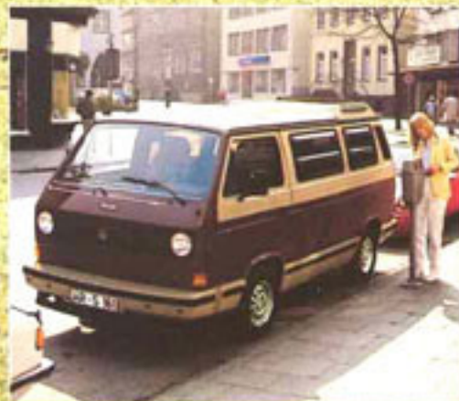
Mit seinem kleinen Wendekreis und seinen Pkw-Abmessungen läßt sich der Profi überall leicht einparken.