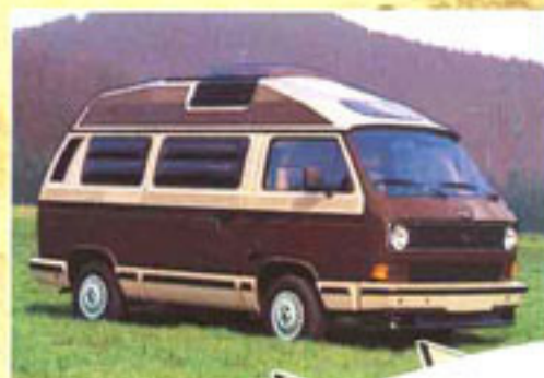
Oder achatbraun/ beige