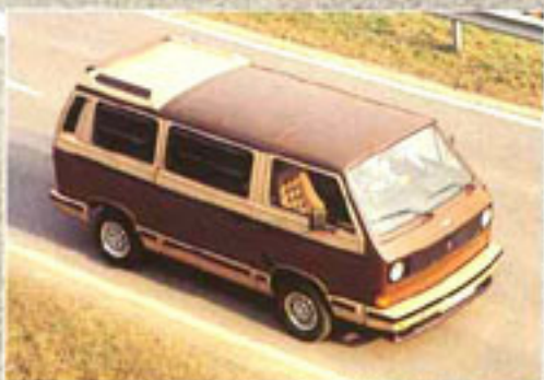
Der Profii mit Flachdach, Gepäckdeck und Zwangsentlüftung (Hub- oder Schiebedach gegen Aufpreis)