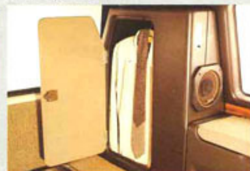
Im Kleiderschrank hängt der Business-Anzug - knitterfrei.