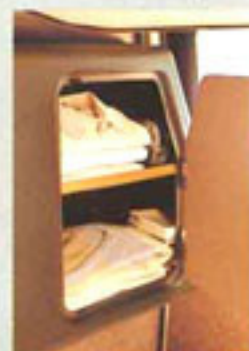
Separater Schrank für Ihre Wäsche.