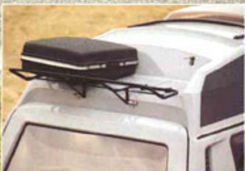
Dieses Hochdach integrierte Gepäckablage kann durch einen aufklappbaren Träger verdop- pelt werden