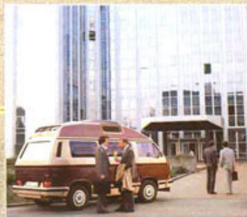
Der Profi ist ein attraktives Büromobil, in dem Sie sich schon während der Fahrt auf Konferenzen vorbereiten können.