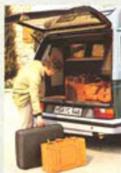
Großer Kofferraum für viel Gepäck.