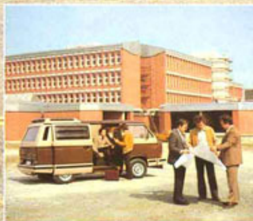
Der Profi bietet viel Platz für ein ganzes Büro. Damit haben Sie alles immer „vor Ort“.