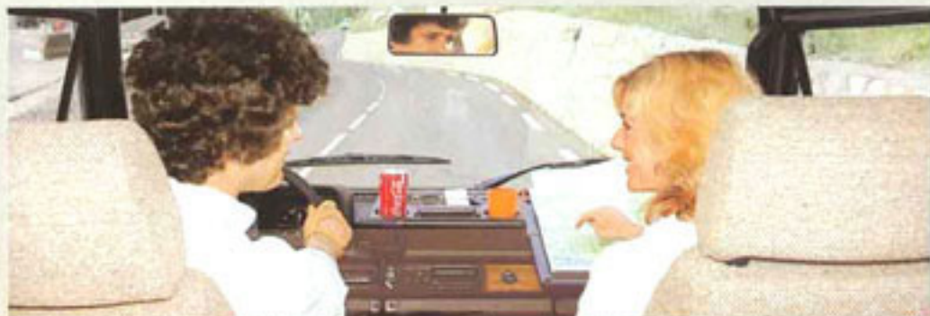
Professionelles Fahrer-Cockpit mit ausklappbarem Kartentisch und Kombi-Ablage für Ihre

Der Profi setzt nicht nur optisch attraktive Akzente, sondern erfüllt auch wichtige, entscheidende Anforderungen im alltäglichen Gebrauch. Selbst die Gürtellinie, der von der Isolierung empfindlichste Bereich, bekam den bestmöglichen Wärme-, Kälte- und Schallschutz.