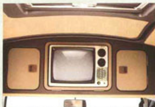
Im Hochdach integriert: Das Fernsehgerät (GL-Ausstattung) und zwei geräumige Staufächer.