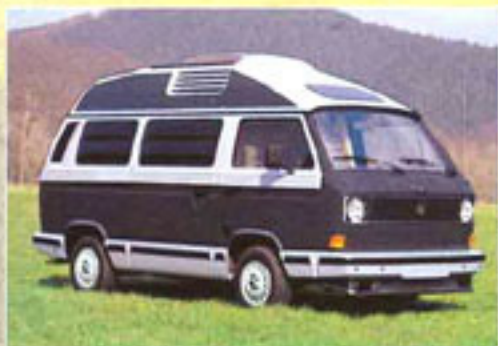
Drei Farbkombinationen anthrazit/hellgrau (Aulpreis)