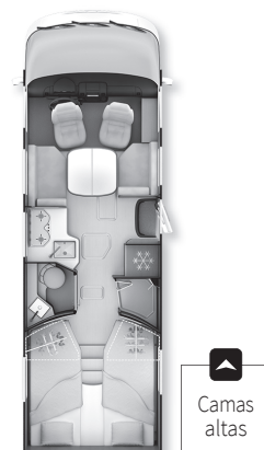
Opción ALDE 8066dF