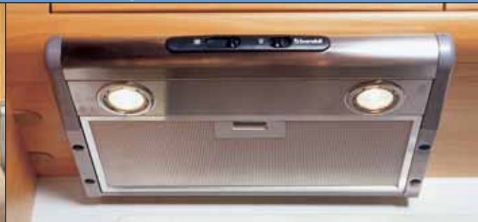
13. Neue Spots