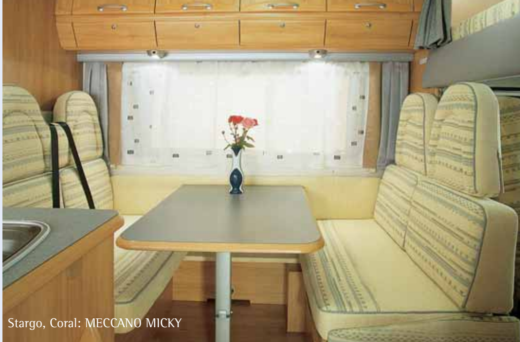
Stargo, Coral: MECCANO MICKY